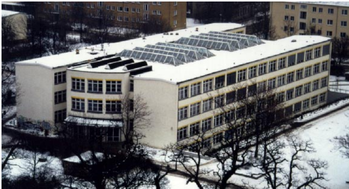
Abbildung 1: Bertolt-Brecht-Gymnasium Dresden

Die deutsche Teilnahme an Annex 35 Aktivitäten wird gemeinsam mit dem Fraunhofer-Institut für Bauphysik in Holzkirchen wahrgenommen. Einerseits werden Beiträge in der Subtask „Analysis Tools“ geliefert, wo es um Weiterentwicklung von Modellen zur Berechnung gemischter Lüftungssysteme geht. Andererseits ist die Dokumentation der Raumluftzustände der „Pilot Study Buildings“ ein wichtiger Arbeitspunkt, da hier wertvolle Informationen von Gebäuden mit gemischten Lüftungssystemen geordnet zusammengestellt werden. Schließlich werden auch Daten zu Normen und Regulierungen der Teilnehmerländer zusammengetragen, die Gebäude mit gemischten Lüftungssystemen betreffen oder berühren. Zahlreiche Informationen zu dem IEA-Projekt, Abbildungen der „Pilot Study Buildings“ und Forschungsberichte sind unter der Adresse: http://hybvent.civil.auc.dk zu finden. Ein „State-of-the-Art-Report“ (auf CD-ROM) über die erste Projektphase kann über das FGK bezogen werden.